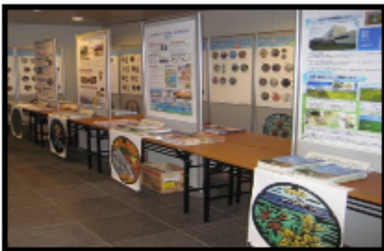
豊富町ブースはコチラ

(実際に展示したのは、道路に設置している、下記写真の下水道本管点検用のデザインマンホール)