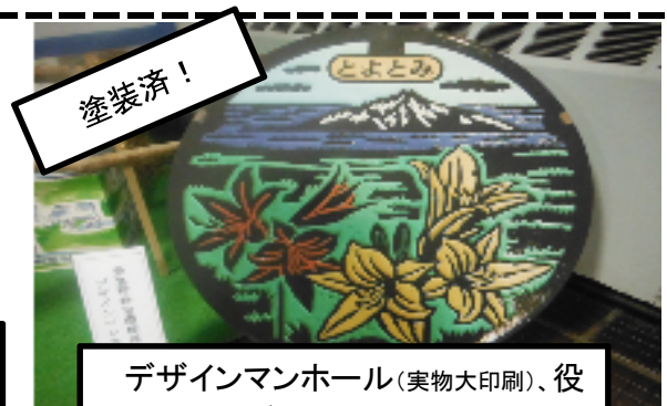
デザインマンホール(実物大印刷)、役場ロビーにて展示中！

「清潔で住みよい環境を保全する。」下水道は、皆様から頂いた下水道使用料にて維持管理しています。